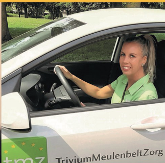
Wijkverpleging bij u thuis