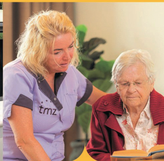
Verpleeghuiszorg op maat

Kijk voor alle mogelijkheden op: www.triviummeulenbeltzorg.nl