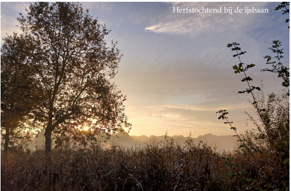
Herfstochtend bij de ijsbaan