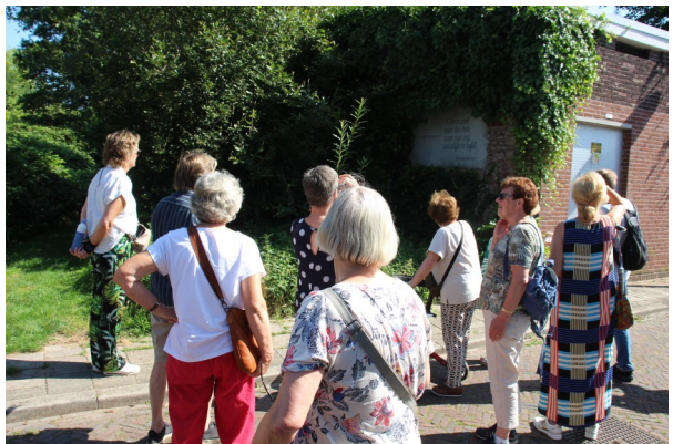
Dinsdagmorgen:wandeling langs muurgedichten