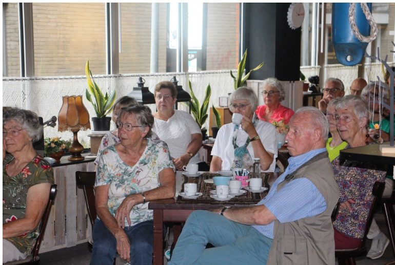
Vrijdagmiddag: afsluitingsfeest in Huis van Katoen en Nu