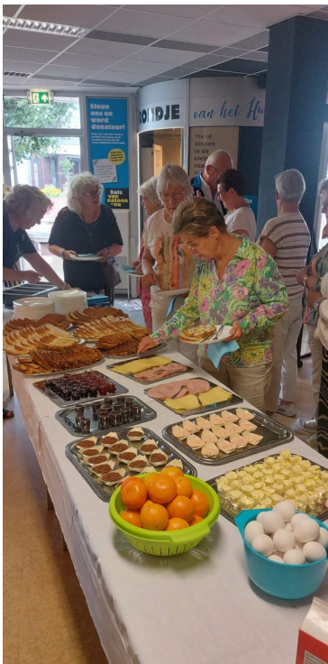
Ontbijt op maandagmorgen

In dit SeniorenJournaal vindt u alvast wat foto's. De verslagen komen in de volgende uitgave.