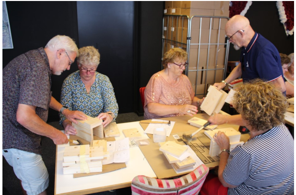
Nestkastjes maken op maandagmiddag